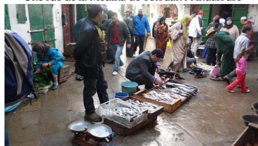
Le marché aux poissons frais (sans la glace)