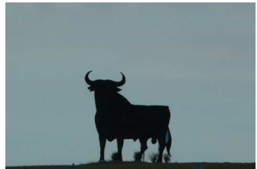
Le Taureau géant symbole de l'Espagne