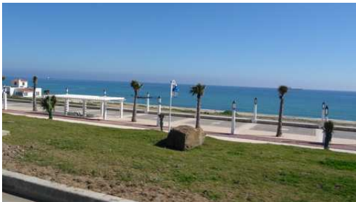
Les dernières images avant la frontière

Après une traversée sur une mer calme et bleue, nous allons passer la nuit près de l'agence Guitteriez à Algésiras.