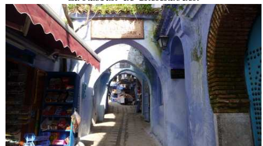
La médina de Chefchaouen