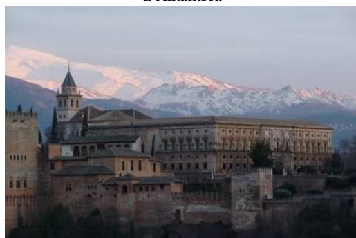
Vue de l'Alhambra avec la Sierra Nevada en fond de paysage