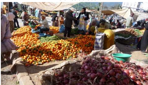
Ambiance du Souk