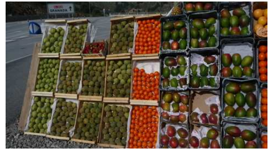
Vente de fruits et légumes entre Motril et Grenade