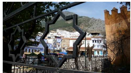
La Kasbah de Chefchaouen