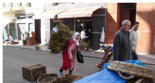
Une paysanne du Rif dans les rue de Tétouan