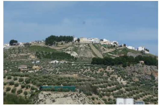
Les étendues d'Oliviers en Espagne