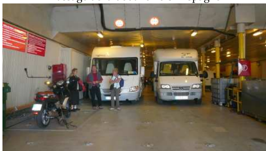
En attente du départ dans le Ferry