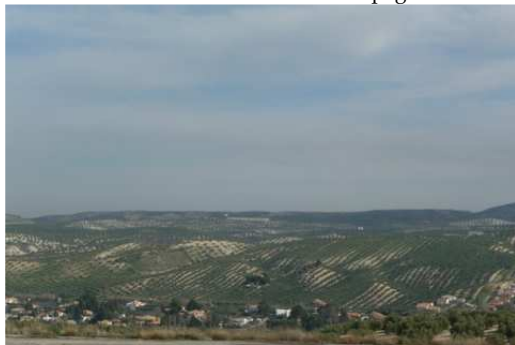
Les étendues d'Oliviers en Espagne