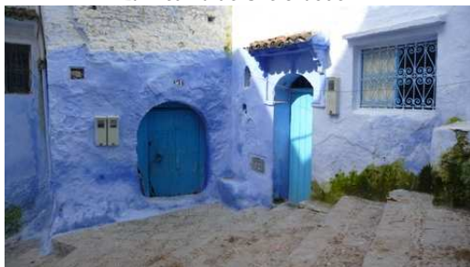
La médina de Chefchaouen