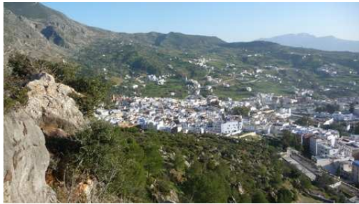
Chefchaouen vue du camping