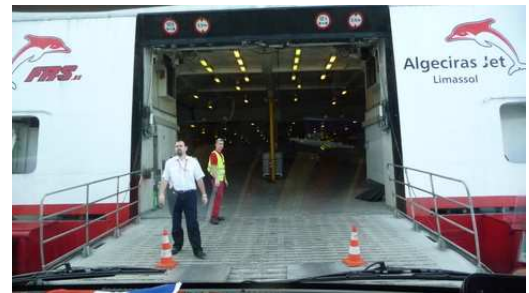
Embarquement pour la traversée