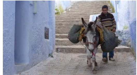
La médina de Chefchaouen