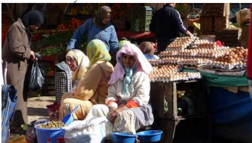
Ambiance du Souk