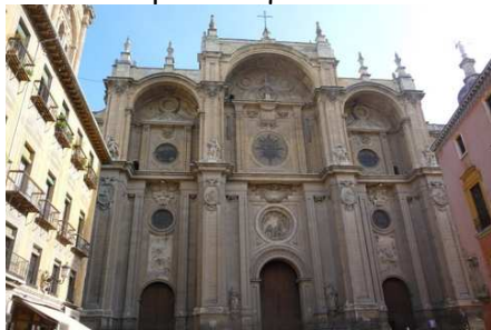
La cathédrale de Grenade

Nous visitons au cours de cette journée la Cathédrale, le quartier Albaicin (le vieux Grenade) et l'Alhambra qu'il ne faut surtout pas manquer.