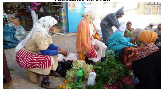
Ambiance du Souk