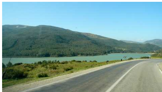
Paysage entre Chefchaouen et Martil