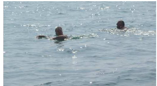
Notre défit de la journée