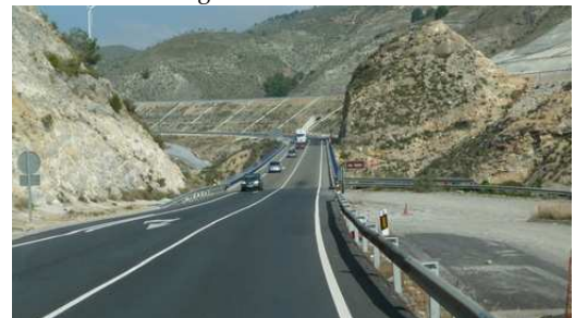
L'impressionnant réseau routier Espagnole