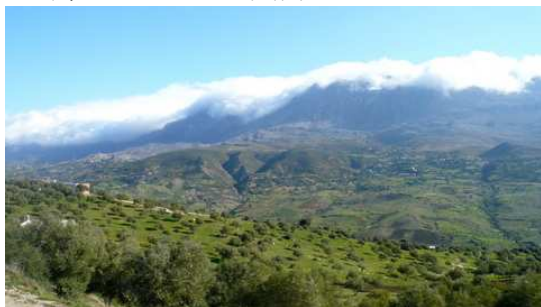
Paysage entre Chefchaouen et Martil

Nous profitons de ce retour à Martil pour faire un brin de toilette de nos véhicules (plutôt sales) après ce périple du Maroc de 4200 Kms.