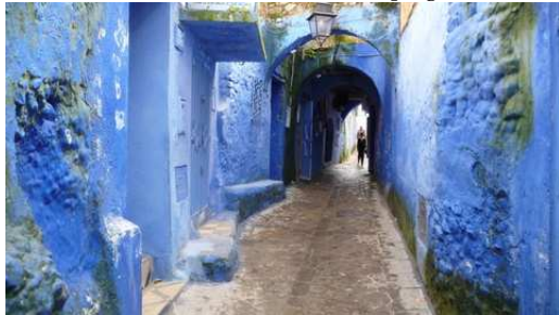
La médina de Chefchaouen