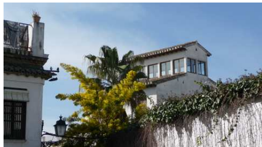
Les Mimosas dans le quartier Albaicin