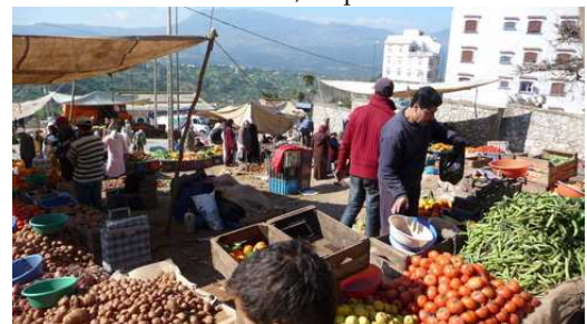
Ambiance du Souk