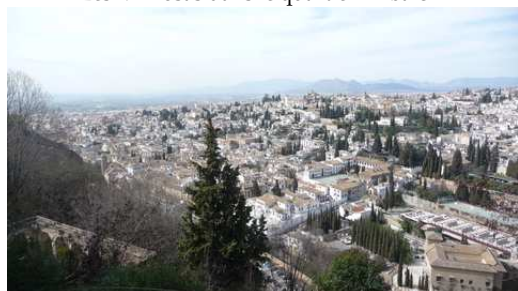
Vue de la ville de Grenade