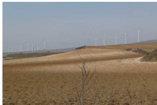
L'Espagne exploite l'énergie du vent mais aussi l'énergie solaire