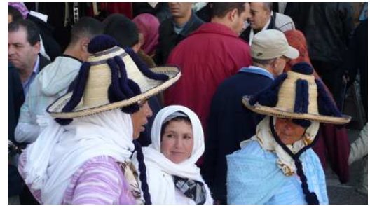
Les marchandes Rifaine