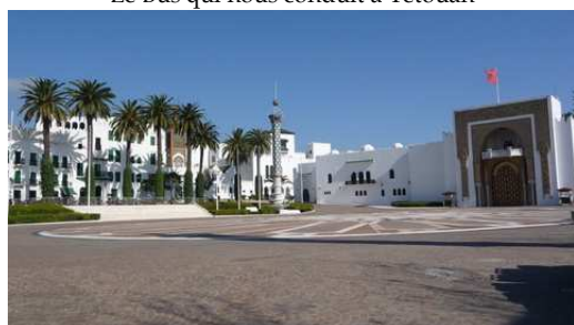
Le palais Royal de Tétouan