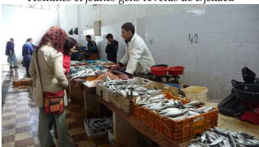
Le Souk au poissons (les sardines en premier plan)