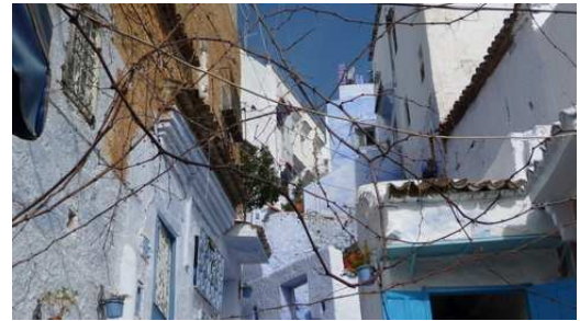
La médina de Chefchaouen