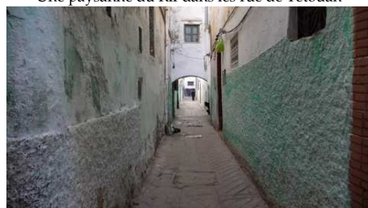
Une rue de la Médina de Tétouan l'Andalouse