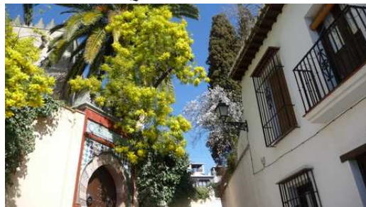
Mimosa et Amandier sous un ciel bleu