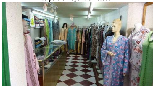
Un fabricant et vendeur de Djellabas