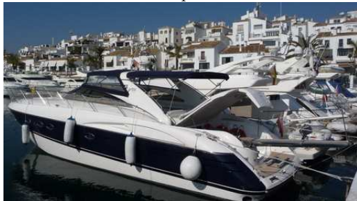
Le Port de Marbella