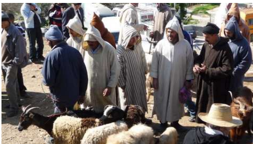
Hommes et jeunes gens revêtus de Djellaba