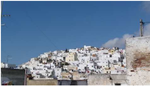
Aperçu de la ville haute de Tétouan