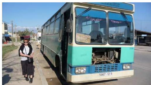
Le Bus qui nous conduit à Tétouan

Retour à Martil par le bus (bondé de monde) pour notre dernière soirée au Maroc avant de reprendre le bateau pour l'Espagne.