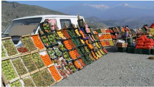
Vente de fruits avec en arrière plan la Sierra Nevada