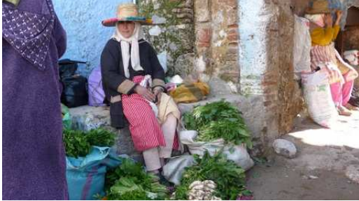
Paysanne en costume Rifain

Nous assistons à une vente de chèvres et de moutons avant de retourner sur les hauteurs de Chefchaouen au camping Azilan pour griller les sardines en provenance du souk.