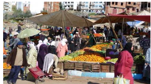
Ambiance du Souk