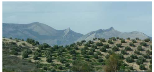
Les étendues d'Oliviers en Espagne