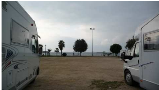
Notre stationnement nocturne à Rincon de la Victoria