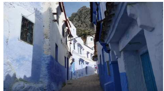
La médina de Chefchaouen