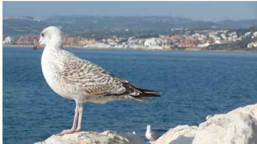
Un Goéland avec en arrière plan la côte de l'Andalousie

Fin de cette journée à Rincon de la Victoria un petit village côtier à quelques kms de Malaga.