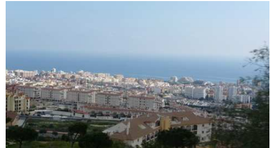
Un aperçu des constructions qui envahissent la Costa del Sol