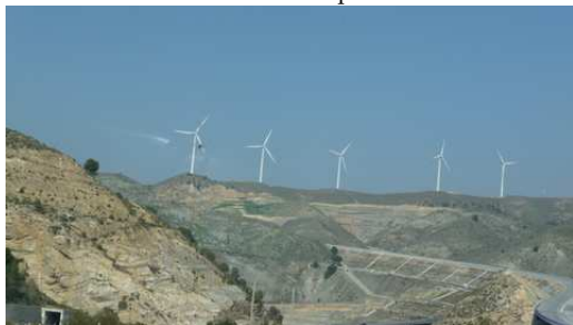
Implantation des éoliennes dans la Sierra Nevada