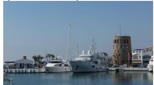
Le Port de Marbella