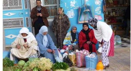
Citadines Voilées, drapées de blanc