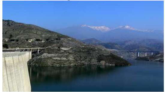
Un Barrage entre Mortril et Grenade