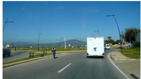
Le service de la voirie Marocaine