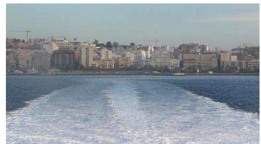
Les côtes Africaines qui s'éloignent