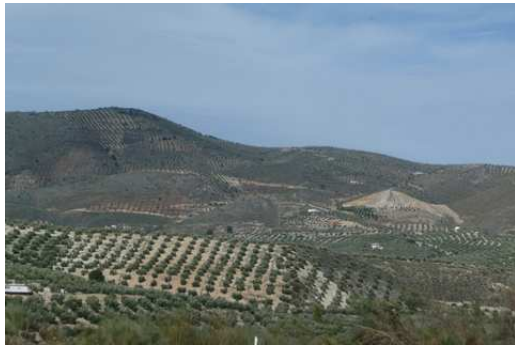
Les étendues d'Oliviers en Espagne

Première grande journée de route pour remonter l'Espagne avec des étendues d'Oliviers à perte de vue en passant par Jaen, Madrid et fin de cette journée au bord d'un lac à Guadalix de la Sierra.