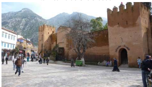
La Kasbah de Chefchaouen