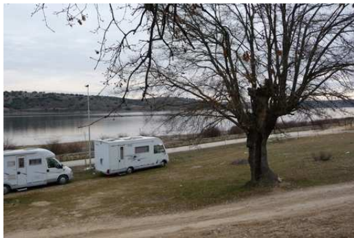
Stationnement au bord du lac à Guadalix de la Sierra

Seconde journée de route pour traverser l'Espagne avec une température qui se rafraîchit au fil des kms et qui commence à nous conditionner, avant de retrouver le climat hivernal français, nous avons un peu oublié depuis notre départ.