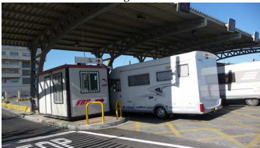
Passage de la douane vers l'Espagne