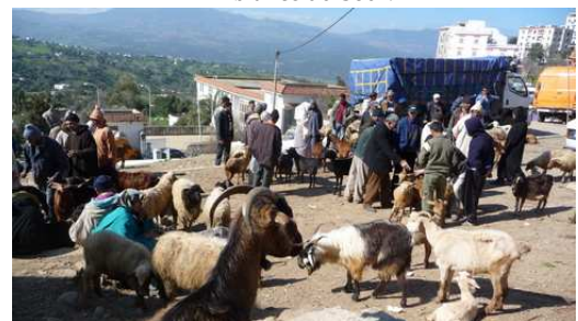
Vente de chèvres et moutons