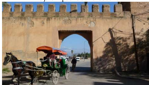
Une des portes de la cité de Taroudant