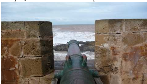
Les canons sur les remparts d'Essaouira