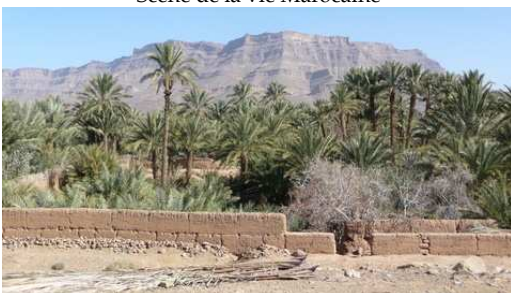
Paysage entre Zagora et Agdz