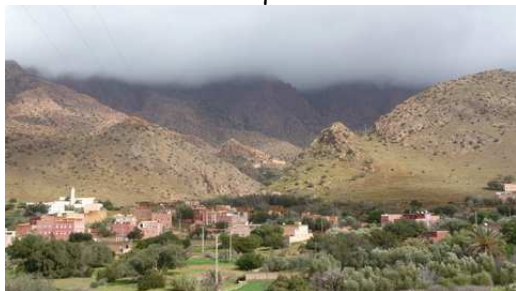
La vallée des Almeln