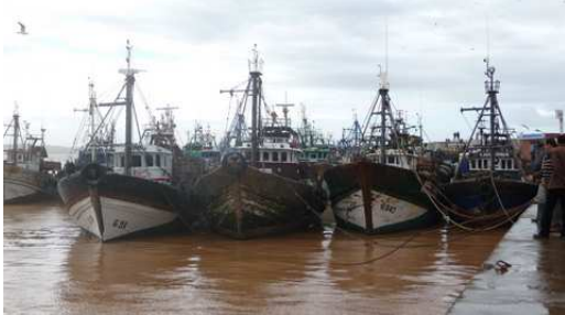
Les bateaux dans le port de Essaouira