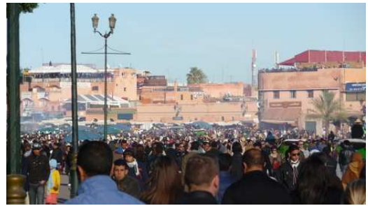
Place Djemaa El-Efna en fin de soirée