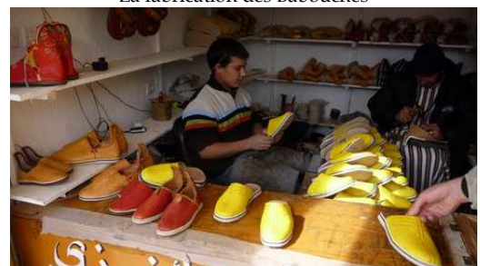
La fabrication des Babouches