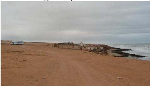
Bivouac à Sidi Toual