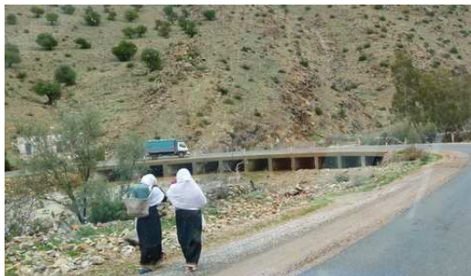
Les femmes voilées en blanc

Quelques kms plus loin, nous terminons notre journée au camping Tazka.