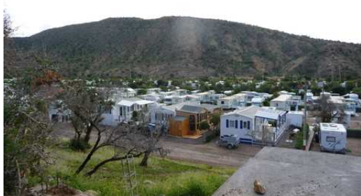
Camping Atlantica Parc de Aghroud

Après une nouvelle nuit de pluie, le soleil est au rendez-vous, ce qui nous permet de visiter ce camping de plus de 800 emplacements avec toutes les infrastructures qui permettent de vivre pendant plusieurs mois dans des conditions idéales. Cet après-midi nous prenons la route qui rejoint Essaouira en longeant la côte et en passant par Tamri où se pratique la culture des petites Bananes. Nous stationnons pour terminer cette journée à Essaouira sur la place Bab Marrakech juste à proximité de la ville fortifiée.