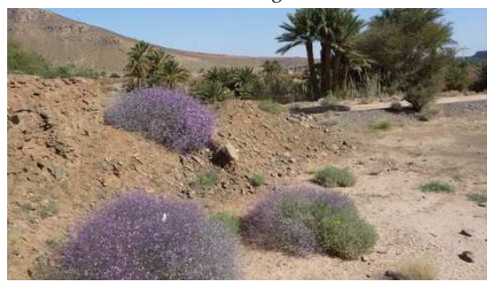
Paysage entre Zagora et Agdz