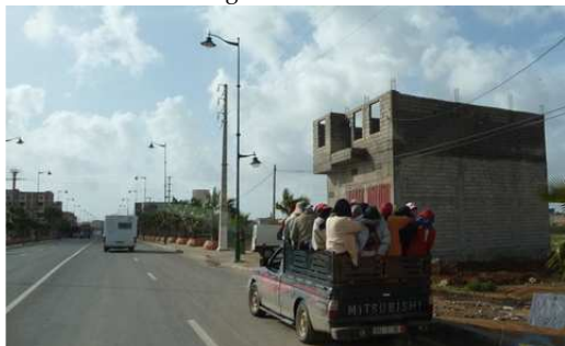
Les femmes allant à la cueillette des Oranges