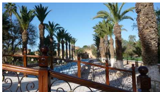
Le jardin public de Taroudant