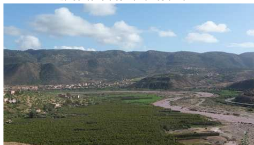
Plantation des bananeraies de Tamri