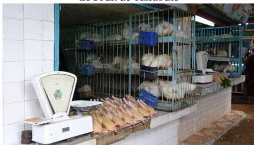
Commerces de Tafraoute