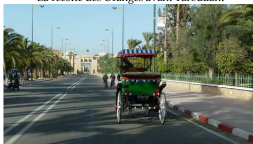
Promenade en Calèche à Taroudant