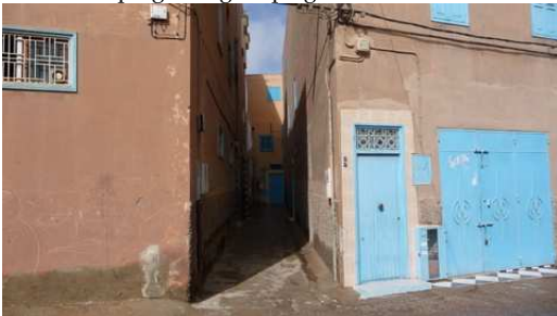
Les maisons roses aux portes bleus de Tiznit