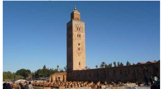
La Mosquée de la Koutoubia

Fin de la Troisième Partie du 29/01/2009 au 08/02/2009