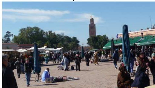
Vendeurs en tout genres place Djemaa El-Efna