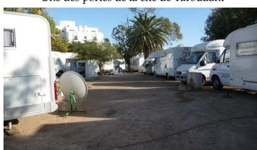
Aperçu du camping international d'Agadir