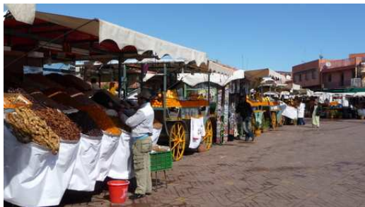
Les marchands d'oranges et de Fruits secs Place Djemaa El-Efna

Après un bon déjeuner Marocain nous visitons le palais de la Bahia avant de reprendre nos véhicules pour regagner le camping de Manzil la Tortue situé à 15 kms de Marrakech en Direction de Ouarzazate.