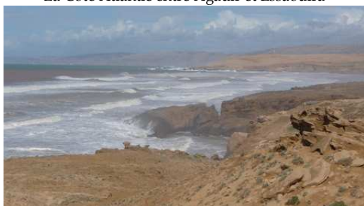
La Côte Atlantic entre Agadir et Essaouira