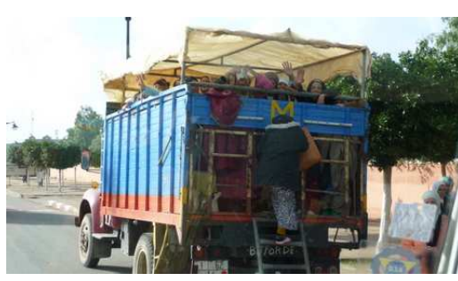
Les femmes allant à la cueillette des Oranges