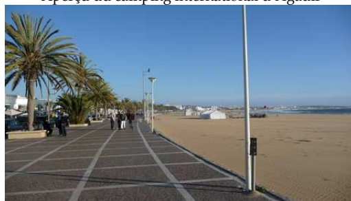
Promenade le long de la plage d'Agadir