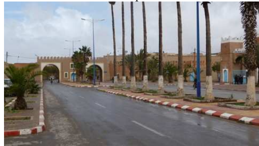
Entrée de la Médina de Tiznit