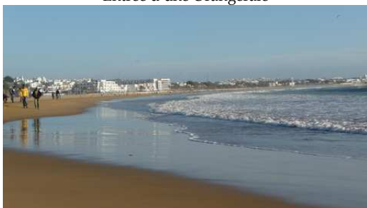
La Plage d'Agadir