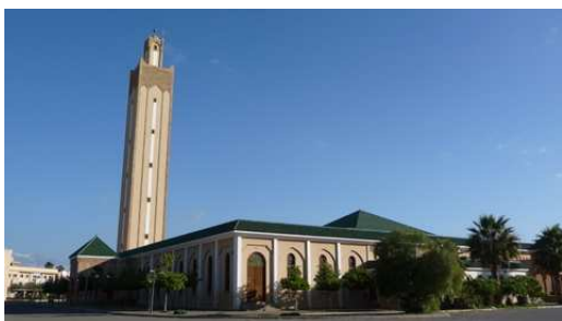
La Mosquée de Taroudant

Nous quittons Agadir à la tombée de la nuit sans aucun regret pour trouver un stationnement à quelques kilomètres au sud d'Agadir en bordure de mer à Sidi Toual.