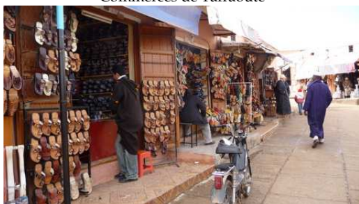
Le Souk des Babouches