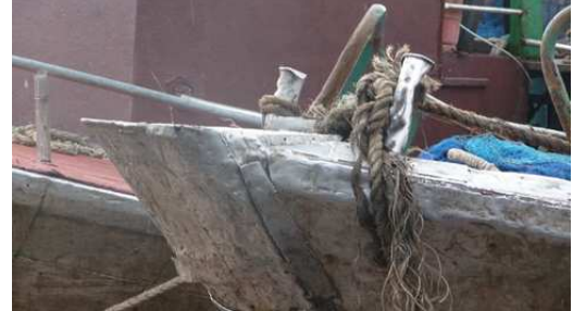
Aperçu de l'état de la flotte de pêche Marocaine