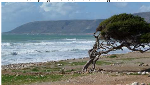
La Côte Atlantic entre Agadir et Essaouira