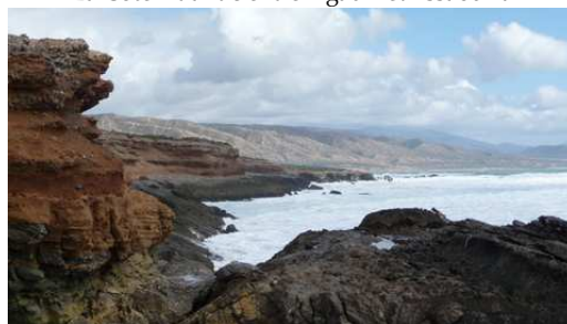
La Côte Atlantic entre Agadir et Essaouira