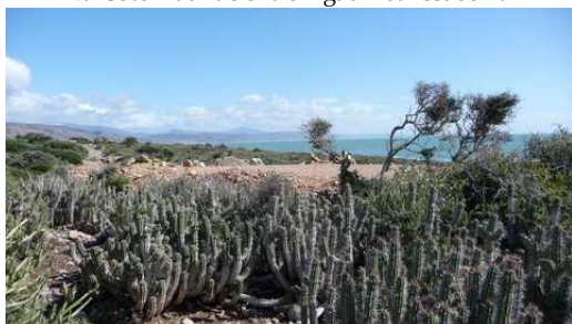
La Côte Atlantic entre Agadir et Essaouira