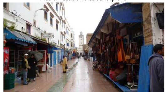
Les d'Essaouira sous la pluie