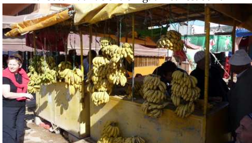
La vente des Bananes à Tamri