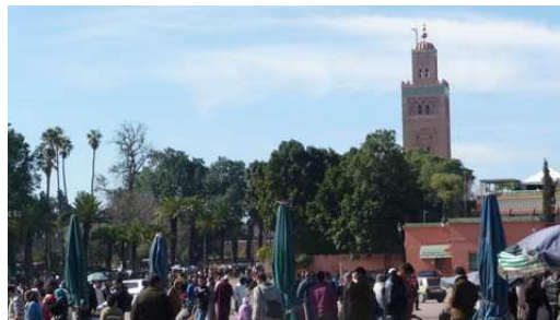
Vue sur la mosquée de la Koutoubia