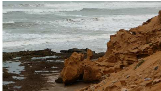
Les rochers de Sidi Toual