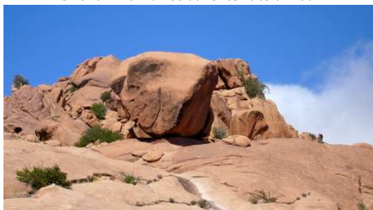
Rocher avec des formes imaginaires