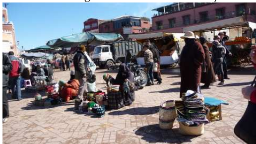
Vendeurs en tout genres place Djemaa El-Efna