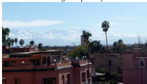
Vue de Marrakech sur les terrasses