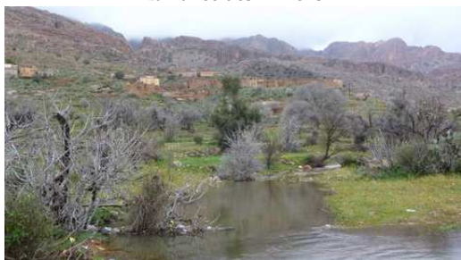
La vallée des Almeln