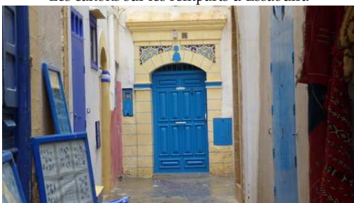
Les couleurs d'Essaouira