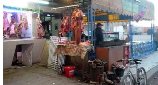
Une Boucherie de Tazenakht