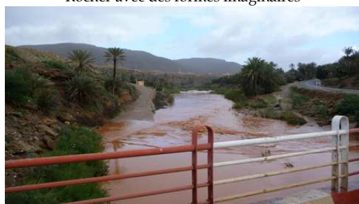
Passage d'un Oued en crue