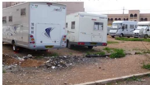
Que recherche-t-on en venant au Maroc