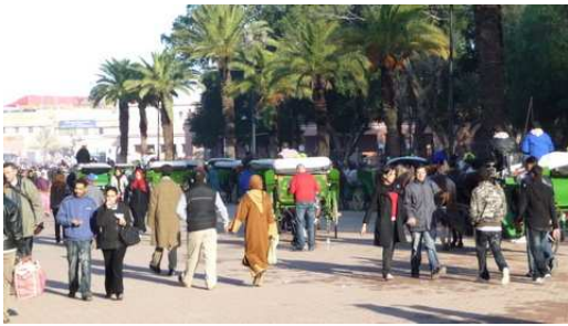
Les rues de Marrakech Animées