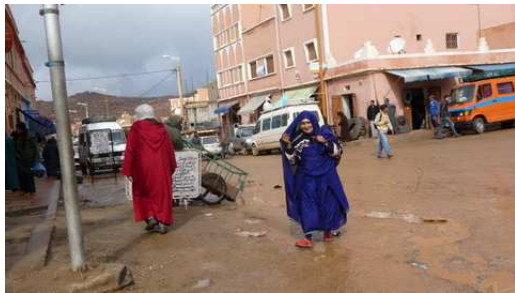
Les rue de Tafraoute après la pluie

Nous passons à la gendarmerie Royale pour connaître l'état de la route du Tizi'n Test que nous devons emprunter demain, mais hélas nous devons envisager une modification de notre itinéraire pour la suite du voyage.