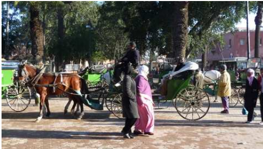
Scènes de rue à Marrakech