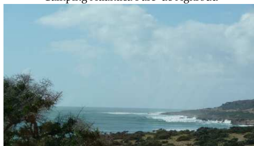
La Côte Atlantic entre Agadir et Essaouira