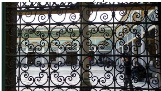
Palais de la Bahia