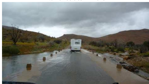
Passage d'un Oued avant Aït Baha