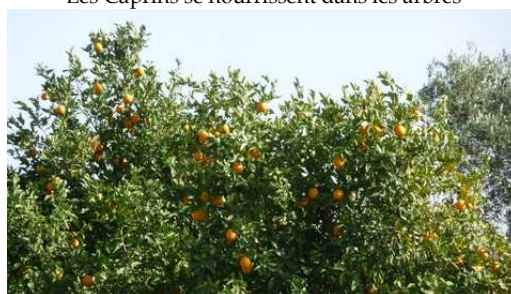
La récolte des Oranges avant Taroudant