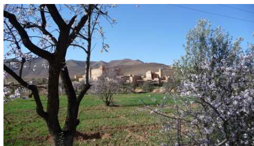
Les arbres en fleurs à l'entrée de Taliouine