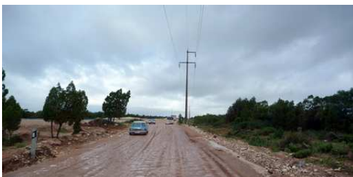
Etat de la route entre Essaouira et Chichaoua