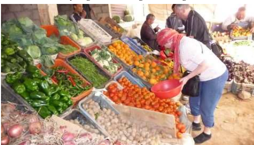
Le ravitaillement à Agdz