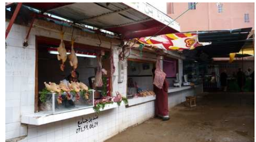
Commerces de Tafraoute