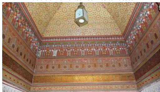
Palais de la Bahia