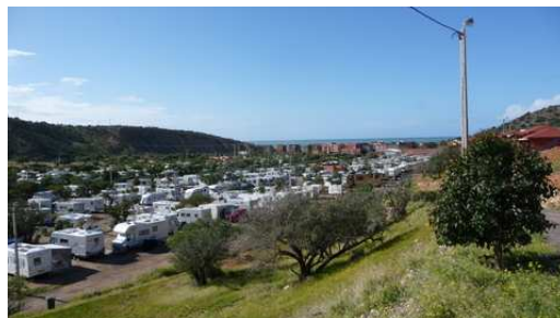
Camping Atlantica Parc de Aghroud