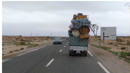
Un transport déménagement Marocain