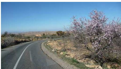
Les arbres en fleurs à l'entrée de Taliouine

Fin de la soirée à Taroudant où nous faisons la visite du Souk avec de nouveau un guide qui s'est imposé. Pour le retour aux camping-cars nous nous sommes égarés, c'est avec un grand détour autour des murailles que nous retrouvons nos domiciles.