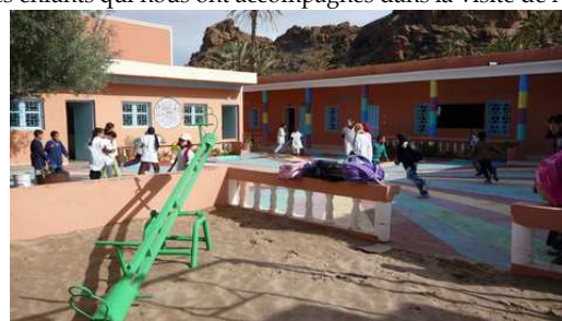
Les enfants dans la cour de l'école d'Adaï