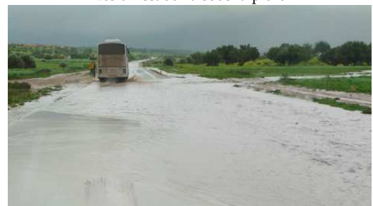
Route traversée par les Oueds entre Essaouira et Chichaoua