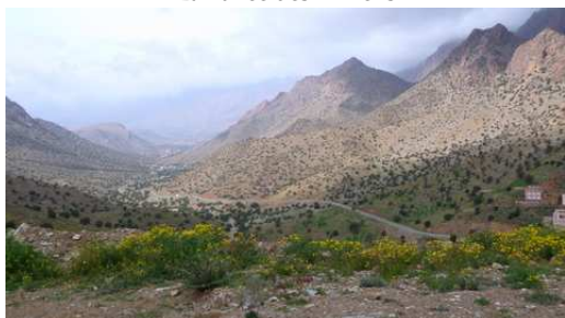
La vallée des Almeln