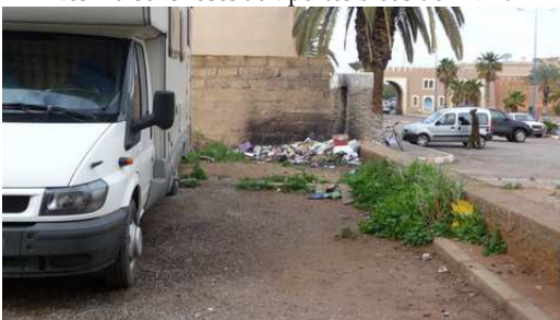
Que recherche-t-on en venant au Maroc