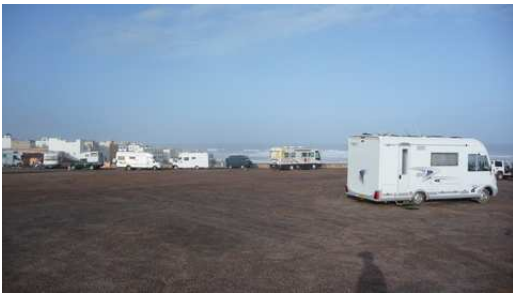
Le Camping de Aglou plage en bordure de mer

Nous en profitons pour flâner dans la médina de Tiznit qui est entourée de 5 kms de remparts en Pisé. Cette cité présaharienne est surtout connue pour ses maisons roses aux portes et fenêtres bleus, où nous passons la nuit. En espérant que le soleil soit de retour demain.