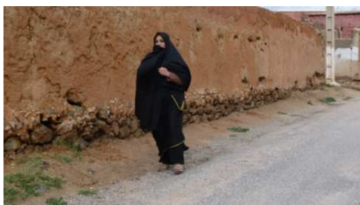
Une femme mariée dans les rues d'Adaï