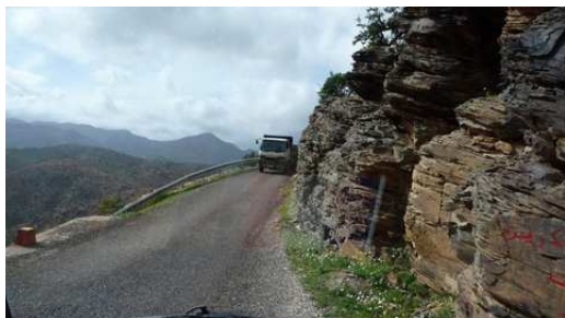
Les Gorges de Aït Mansour