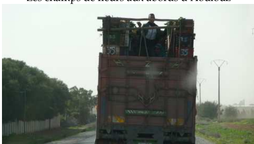
Le transport des Oranges