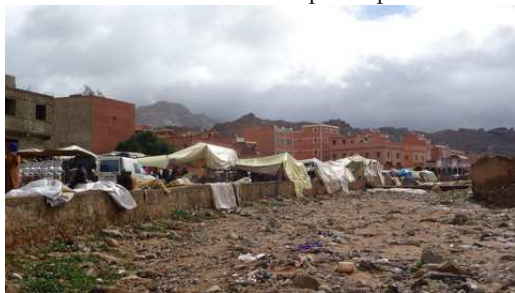
Le Souk de Tafraoute