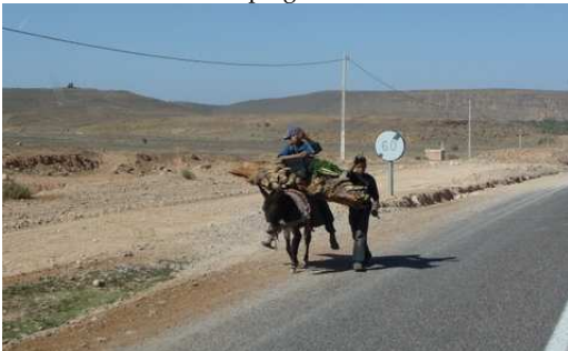
Scène de la vie Marocaine