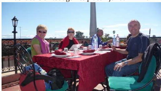
Une petit restaurant bien sympa à Marrakech