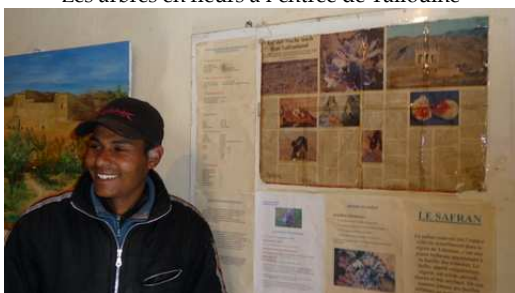
Explication de la récolte du Safran à Taliouine