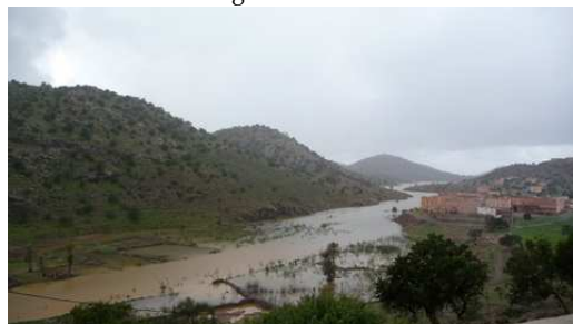
Les crues à Aït Baha