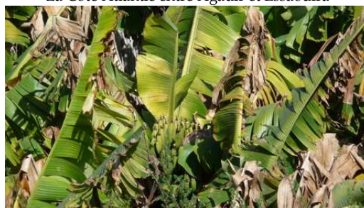
La culture des Bananes à Tamri