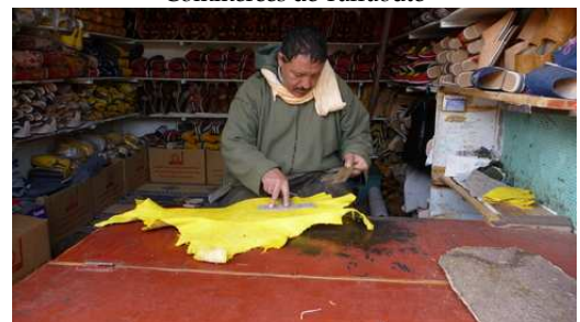
La fabrication des Babouches