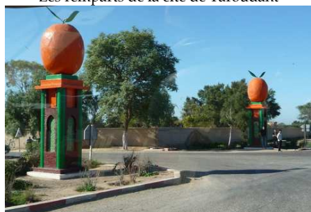
Entrée d'une Orangerie