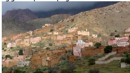
La vallée des Almeln