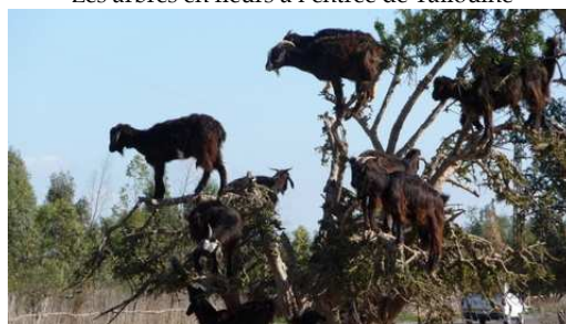
Les Caprins se nourrissent dans les arbres