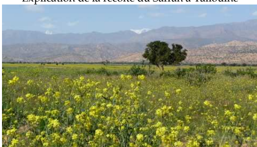
Les champs de fleurs aux abords d'Aoulouz