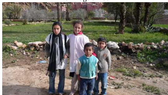
Les enfants qui nous ont accompagnés dans la visite de Adaï