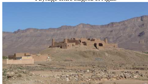
Paysage entre Zagora et Agdz