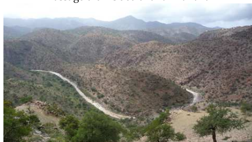
Les Gorges de Aït Mansour