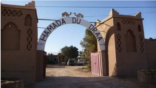
Entrée du Camping Hamada du Draa

En faisant une ballade dans cette ville "moderne", nous sommes surpris par le nombre de commerces de boucherie. Chose également agréable dans cette ville, nous ne sommes pas importuné, ni par les enfants, ni par les adultes.