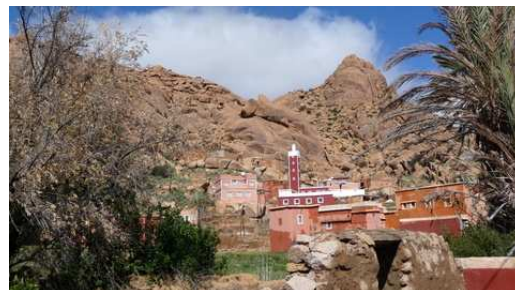
Le village d'Adaï