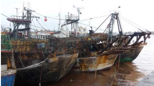
Aperçu de l'état de la flotte de pêche Marocaine