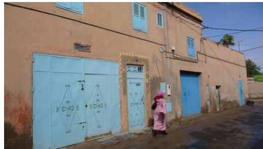
Les maisons roses aux portes bleus de Tiznit