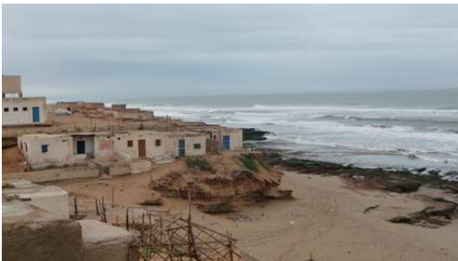
Plage et village de Sidi Toual

Nous partons pour regagner Tiznit, mais là encore en arrivant au camping international nous trouvons un gueto de camping-cars et pas de place pour les itinérants que nous sommes. C'est à Aglou plage que nous trouvons ce camping pour refaire les pleins et passer la nuit.