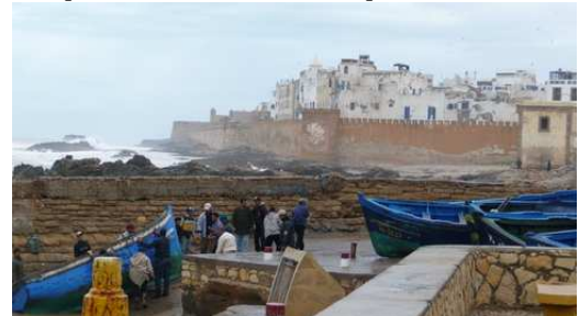
Vue sur la ville blanche et bleue d'Essaouira