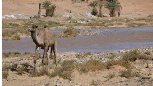
Un dromadaire à l'entrée de Zagora sur les bords du Drâa