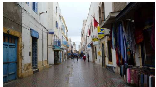
Les d'Essaouira sous la pluie