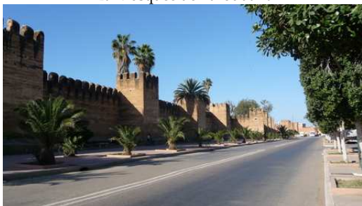
Les remparts de la cité de Taroudant