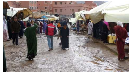
Le Souk de Tafraoute