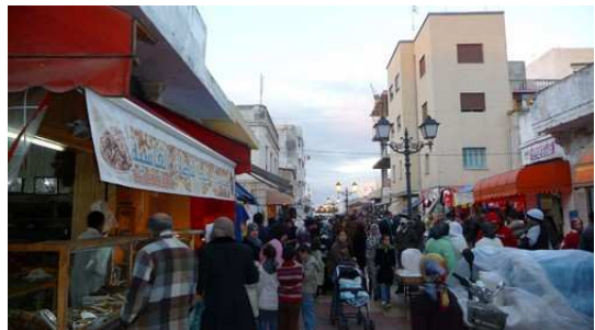
Le Souk de Martil