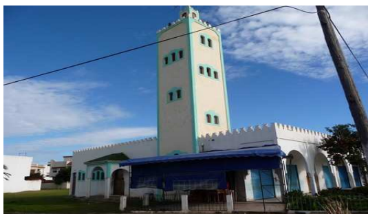
Mosquée de Bou Hamed

nous a reçu d'une manière formidable. Nous reprenons la route en direction de El jedha (la pointe des pêcheurs) ou nous arrivons de nuit et avec beaucoup de difficultés liés à l'état des routes. C'est la gendarmerie qui nous indique l'endroit où stationner en toute sécurité dans un parking fermé et surveillé. Malgré cela nous sommes très inquiets en cette fin de soirée car la route que nous devons poursuivre le lendemain risque d'être fermée suite à des fortes chutes de neige tombées sur les sommets.