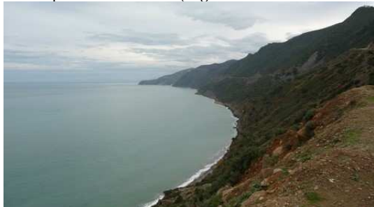
La côte Méditerranéenne entre Bou Hamed et El Jedha