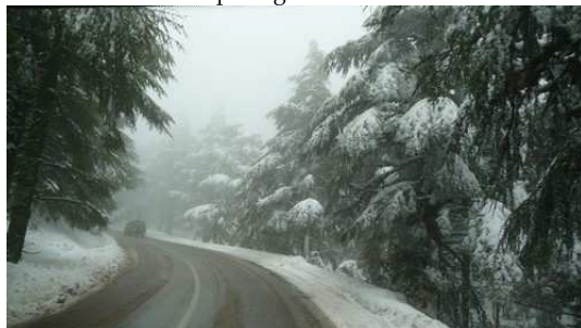
Les routes enneigées près de Ketama