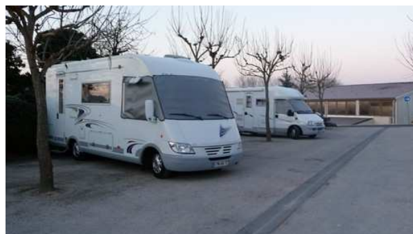
Le premier stationnement à Baignes