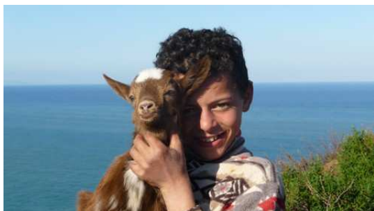
Un petit Marocain qui gardait les chèvres