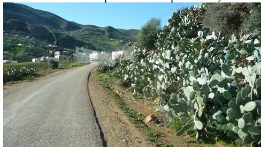
Paysage en El Jedha et Ketama