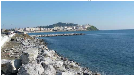
Sortie de la ville de Ceuta