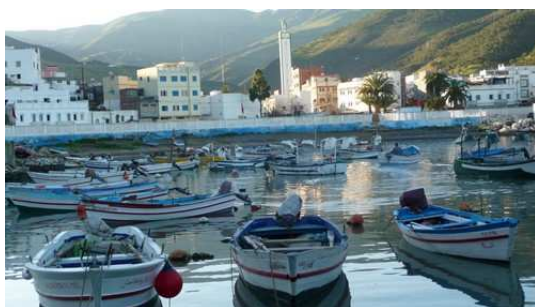
Le Port de El Jedha

Ce matin avant de quitter El Jedha nous nous rendons à la gendarmerie pour connaître l'état de la route de montagne qui va nous permettre de rejoindre Ketama et la route de l'Unité qui nous mènera à Fès. C'est donc avec un avis favorable de la gendarmerie et après avoir fait une visite dans ce village de pêcheurs que nous entamons cette longue route étroite qui va nous faire découvrir des paysages sublimes. Mais cette route pas toujours en bon état nous réserve de nombreuses surprises, trous, passage à gué, mise en place de pierres pour arriver à passer et pour finir la neige, le brouillard et le verglas. Heureusement après avoir quitté Ketama, la route de l'Unité réputée pour les vendeurs de Kif (drogue issue du chanvre) qui rejoint Touanate ou nous voyons une ville en pleine effervescence qui attend la visite du roi pour la fin de cette semaine. Après Touanate la route qui rejoint Fès sera nettement plus favorable malgré un trafic important et nous permettra de terminer cette journée au camping international de Fès.