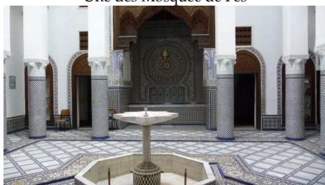
Un Riad transformé en Musée