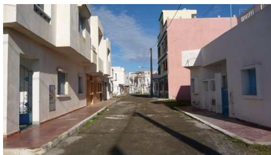
Rue déserte de ou Hamed