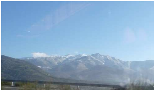
Les montagnes de la Sierra de Villa sous la neige

Nous quittons le village de Canivaz après avoir été chercher le pain dans une Panaderia typiquement Espagnol et fait le plein d'eau en utilisant la fontaine située près de notre stationnement nocturne. Au cours de cette journée de route nous verrons beaucoup d'Oliviers et les immenses étendues agricoles Andalouse. Nous terminerons notre journée au Camping Club de Campo dans la ville de Dos Hermanas qui est située à quelques kilomètres au sud de Séville.