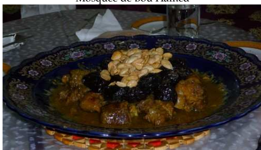
Plat de Caprin aux Pruneaux (dégusté lors de notre invitation)