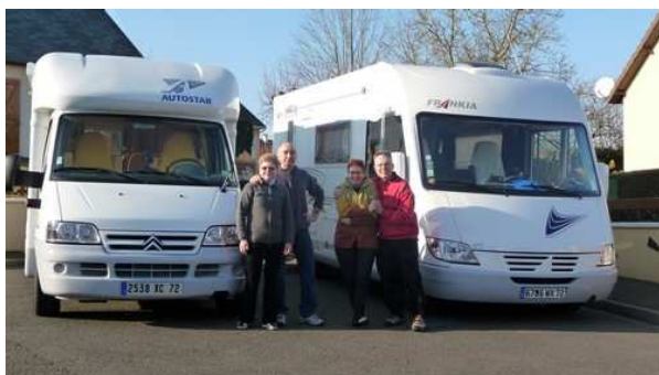
La photo du départ de La Suze

Départ de La Suze en début d'après midi sous un soleil printanier mais un froid glacial. Nous arrêtons au terme de cette première journée dans le village de Baignes situé à une soixantaine de kilomètres de Bordeaux.