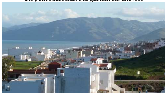
La côte de Oued Laou