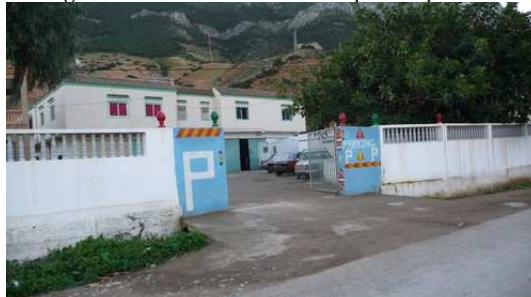
Stationnement dans un parking privé à El Jedha