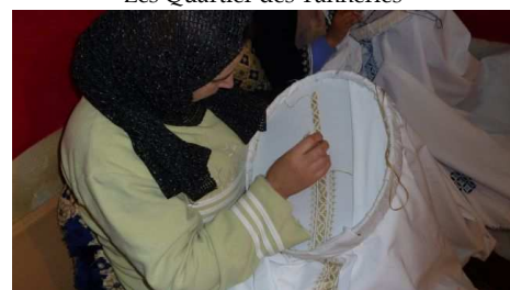
Une brodeuse de Nappes