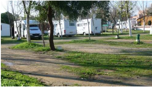
Le Camping Alboustane à Martil

Nous passons la fin de cette soirée à flâner le long du front de mer et dans les rues animées par des marchands ambulants en tout genres. Notre constat de cette première journée au contact des Marocains nous permet de vérifier que l'accueil est à la hauteur de ce l'ont avaient entendus dire "formidable".