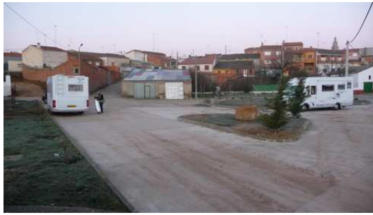
Stationnement sur la place de Canivaz

Une journée de route sans soleil au travers des montagnes du pays Basques en passant par Victoria, Burgos, Palencia, Valladolid et terminer cette journée dans le petit village de Canizal situé à quelques kilomètres de Salamanca.