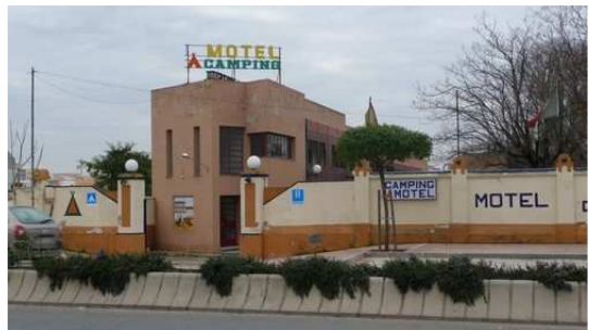
Camping Club de Campo