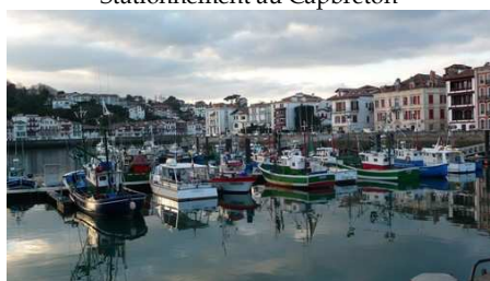
Le Port de St Jean de Luz