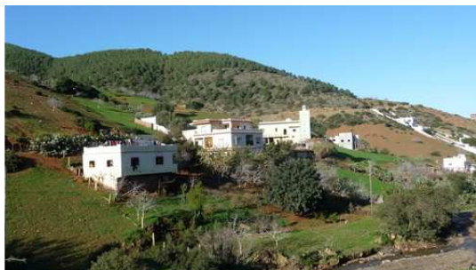
Paysage entre Martil et Bou Hamed