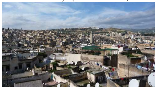
Vue de la Medina de Fès