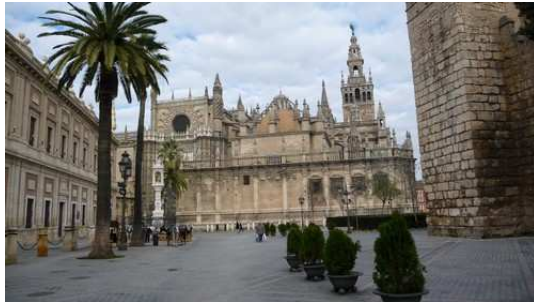
La cathédrale et sa Giralda

Retour par le bus à Dos Hermanas au camping club de Campo pour terminer cette journée.