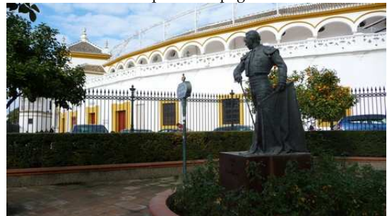
Les Arènes de Séville