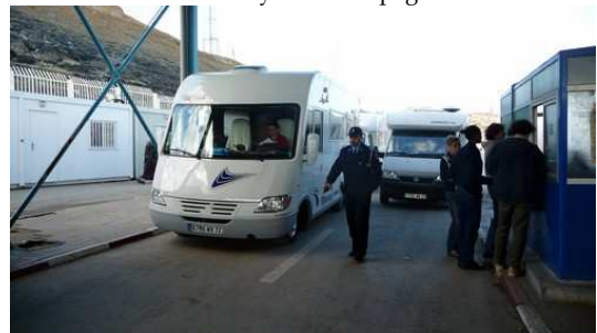
Passage de la douane Esp - Maroc