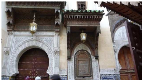
Une des Mosquée de Fès