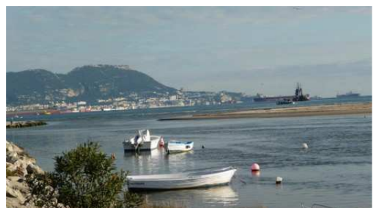
Le front de mer et le rocher de Gibraltar