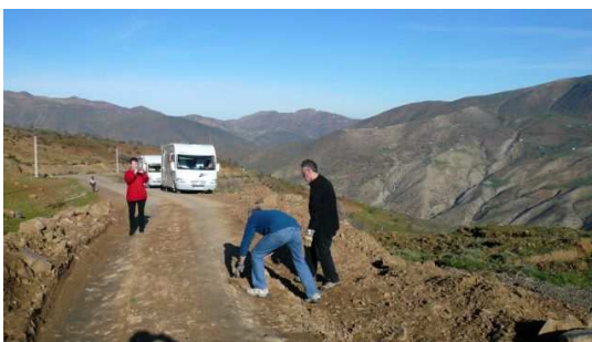
Réfection de la route pour arriver à passer avec les camping-cars