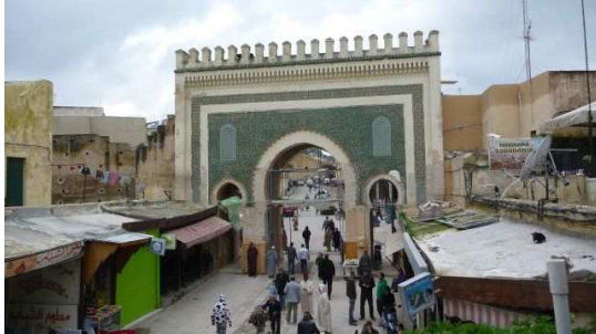
La Porte de la Medina Bou Jeloud

Après une journée de repos, nous retournons à Fès en utilisant les célèbres petits taxis pour continuer les visites du Palais Royal, Le contour des remparts, Le quartier Fès Jdid ou nous ne pourrions pas accéder pour cause de présence du Roi à Fès en ce moment. Nous poursuivons notre visite en utilisant l'avenue des Français face à la Kasbah des Cherarda pour arriver à la place Bou Jeloud et entrée dans la Médina par cette célèbre porte. Après avoir dégusté notre premier Couscous Marocain nous continuerons la visite de la Médina en faisant de nombreuses haltes dans les différents commerces pour s'inspirer des prix pratiqués et pour connaître notre talent de négociateur.