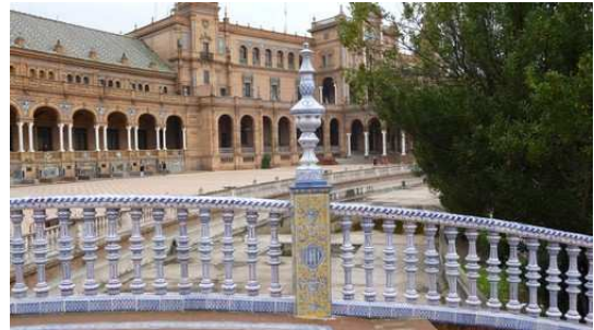
La place d'Espagne