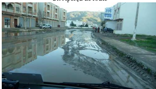
Traversée de village