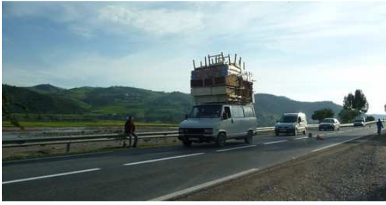
Un exemple de chargement à risque