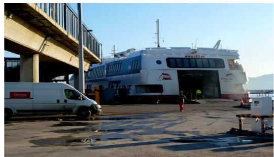
Entrée du Ferry de la compagnie FRS