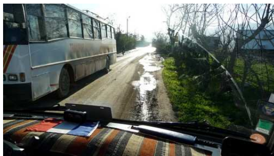
Un Aperçu de route