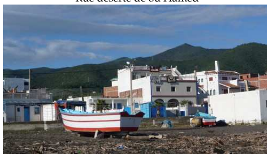
Plage de Bou Hamed avec les barques de pêcheurs