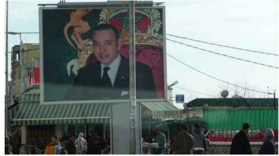
Préparation pour la visite du roi à Touanate