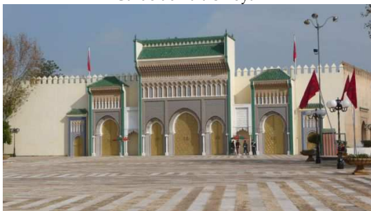
Le Palais Royal (Place des Alaouites)