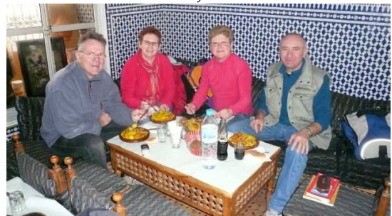
Notre Premier Couscous Marocain