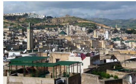
Fès vue du haut d'un Riad