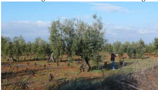
Arrêt dans un Oliveraie