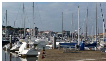
Stationnement au Capbreton