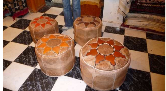
Commerce de Pouf dans la Médina