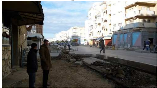
Les rue de Martil en travaux