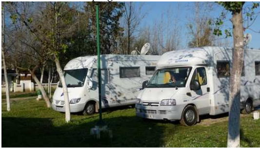
Journée de repos à Martil (Camping Alboustane)