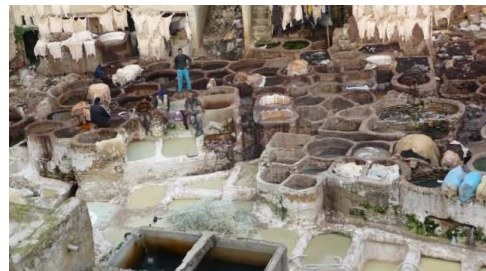
Les Quartier des Tanneries