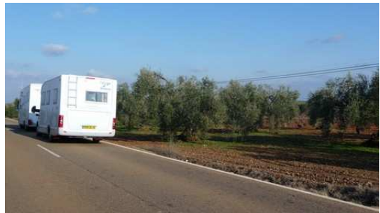
Arrêt dans un Oliveraie