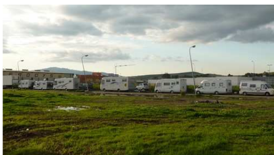
Les camping car en attente du départ devant l'agence Gutierrez

Nous profitons du soleil de cette journée pour faire une ballade sur le front de mer où l'on aperçoit le détroit de Gibraltar et la cote Marocaine.