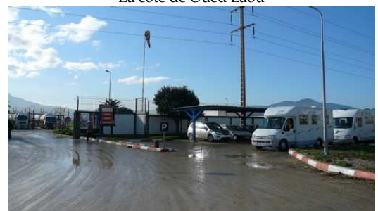
Plaien de gaz à l'usine Salam Gaz de Tétouan