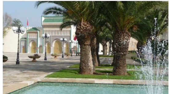
Le Palais Royal (place des Alaouites)