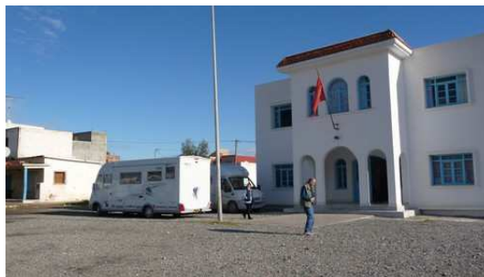
Stationnement devant le bâtiment de la préfecture de Bou Hamed