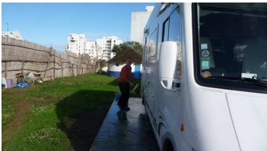
Lavage des Camping cars au camping Al Boustane

Nous profitons de cette journée pour faire une petite toilette aux camping-cars qui ont accumulés beaucoup de pollution depuis notre départ. En milieu d'après midi nous retournons dans le centre de Martil en passant par le Souk ou de nombreux Marocain sont rassemblés.