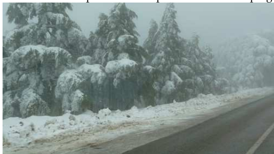
Les routes enneigées près de Ketama