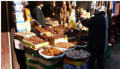
Commerce dans la Médina

Retour au camping à 6 dans un taxi et dans un nuage de pollution causée par l'important trafic routier.