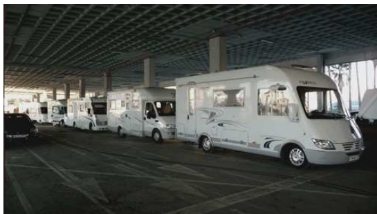
Entrée Embarcadere Algesiras

C'est après quelques kilomètres et après avoir remplacé nos € contre des Dirhams que nous arrivons au camping Alboustane de Martil qui est placé à 300m du bord de mer.