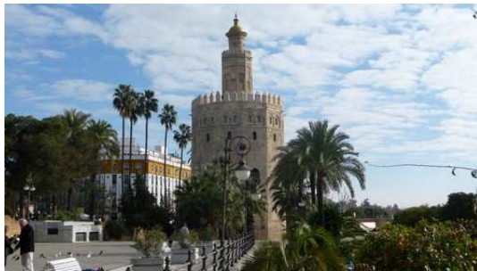
La Torre del Oro