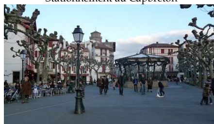
Le Kiosque de St Jean de Luz