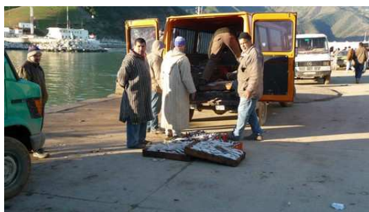
Le Commerce du poisson sur le port de El Jedha