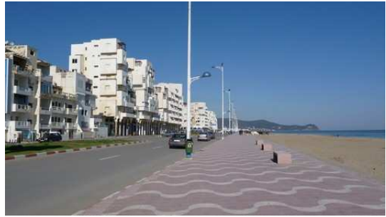
La Plage de Martil