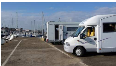
Stationnement au Capbreton

Après une nuit glaciale nous reprenons la route en direction du pays Basques, nous faisons une halte pour déjeuner à Capbreton au bord du port de plaisance sous un soleil de printemps. L'après-midi nous continuons notre route en direction de l'Espagne en faisant une halte à St Jean de Luz pour faire une agréable promenade le long de la plage et les rues piétonnes. Après cette visite nous reprenons la route pour passer en Espagne et nous arrêter sur le port de Hondarribia.