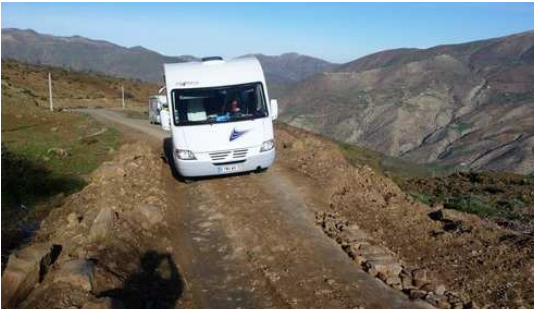
Un passage très délicat