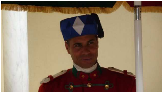
Garde du Palais Royal