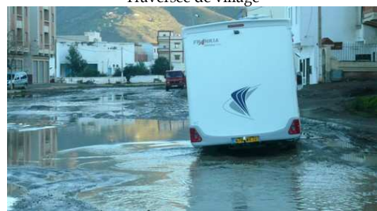
Passage difficile sur la route de Bou Hamed